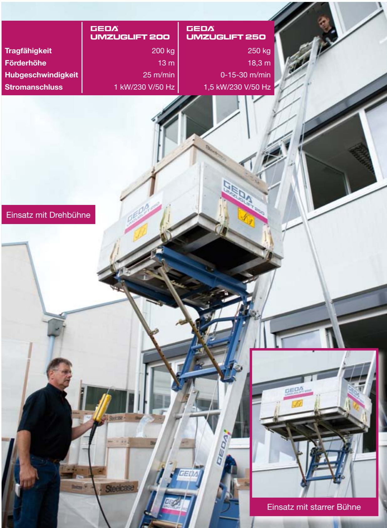
Einsatz mit starrer Bühne