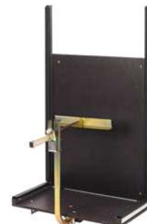
Piattaforma di carico Solar Art. Num. 02908