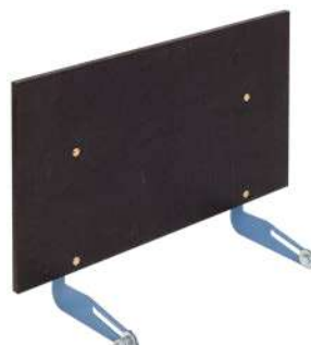
Protezione frontale piattaforma di carico universale Art. Num. 02862