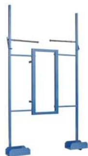
Porta lastre regolabile Art. Num. 02831