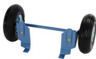
Carrello di trasporto Art. Num. 02886