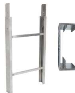
Elemento scala 1 m 250 kg Art. Num. 02889