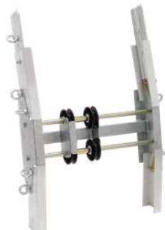
Curva Art. Num. 02877