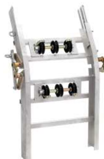
Curva Art. Num. 02828