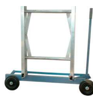
Carrello per spostamenti laterali Art. Num. 02822