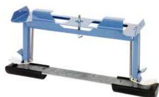
Cavalletto appoggio per tetto Art. Num. 02826