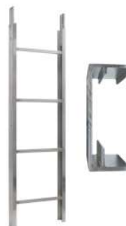
Elemento scala 2 m 250 kg Art. Num. 02888