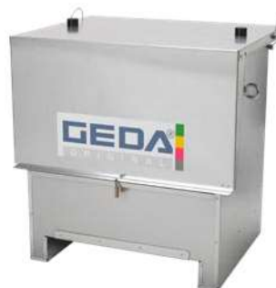
Liftbox Art. Num. 46309

Per ulteriori accessori visita: www.geda.de