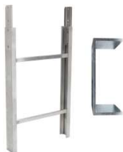
Elemento scala 1 m 200 kg Art. Num. 03379