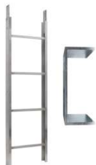
Elemento scala 2 m 200 kg Art. Num. 03378