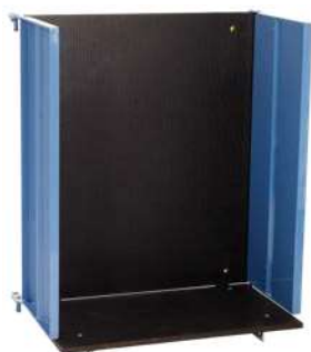
Piattaforma di carico universale Art. Num. 02893